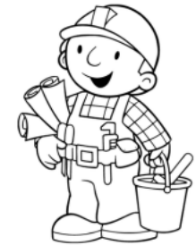
Специалист по организации строительства

Взаимоотношения, возникающие при осуществлении СРО контроля за деятельностью своих членов