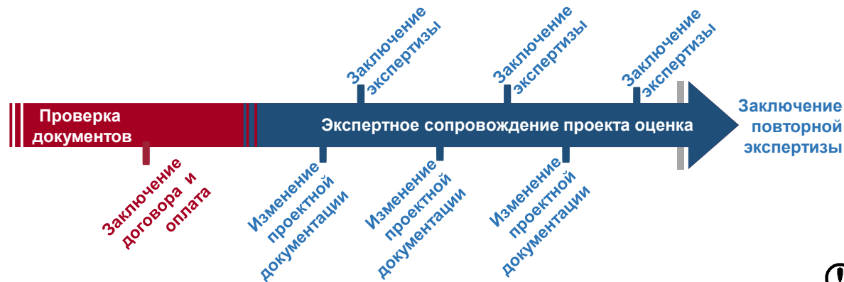
Схема экспертного сопровождения проекта:

Оценка соответствия изменений, внесенных в проектную документацию может осуществляться экспертной организацией в форме экспертного сопровождения